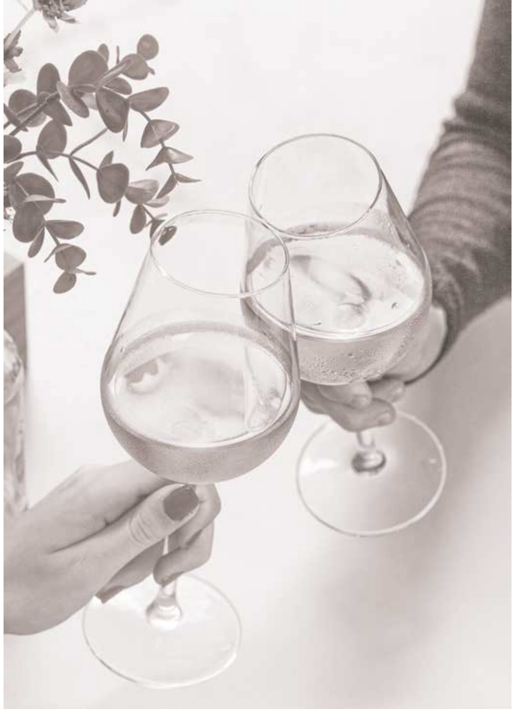
COPAS GLASS OF WINE